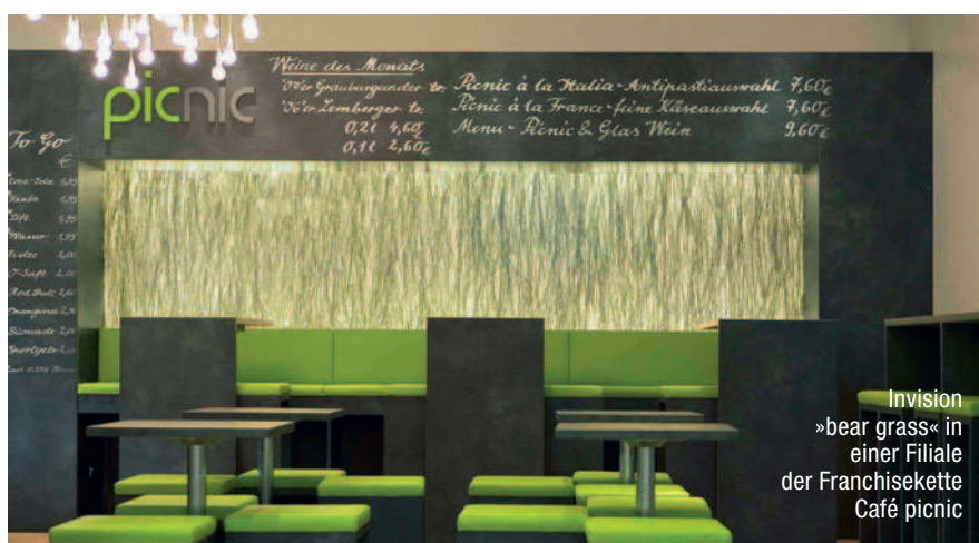
Invision »bear grass« in einer Filiale der Franchisekette Café picnic

Designpanel Invision ist transluzent und für Hinterleuchtung verschiedener Art bis 70°C geeignet. Besonders elegant ist die Kombination mit der Produktreihe »Lightpanel«. Die LED-Lichteinspeisung über die Kanten sorgt für eine homogene Lichtverteilung bei einer Bautiefe von nur 28 mm. Das Sandwich besteht aus der Front in satiniertem Acrylglas, einer