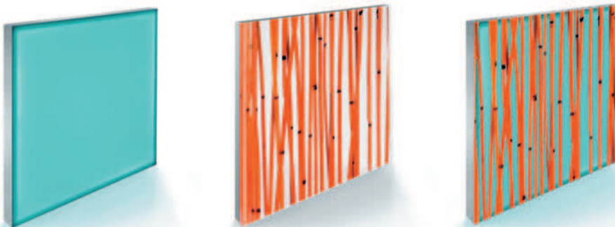
Lightpanel (links) und Invision »Bamboo« verbinden sich zum hinterleuchteten Sandwichelement

Seitenlicht emittierenden Acrylscheibe und auf der Rückseite einer Reflektorscheibe mit umlaufendem Rahmen aus Aluminium. Lieferbares Format bis 3000 x 2000 mm. Lightpanel bildet im Verbund mit Invision eine effektvolle illuminierte Front. Lightpanels sind als Sonderanfertigung auch mit gebogener Oberfläche möglich.