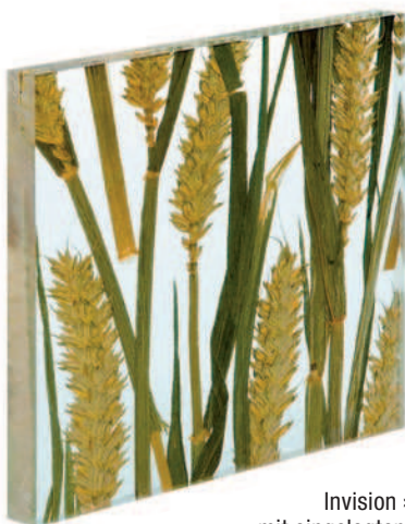
Invision »Corn« mit eingelegten Ähren

beitet. Acrysign hat bereits zur ZOW im Februar 2009 Hocker mit Sitzflächen aus dem aktuell bis 1000 x 1000 mm großen Werkstoff gezeigt. Zenshine lässt sich Fräsen, Bohren, Sägen, Scheren und Stanzen, Laserschneiden, Kalt- oder Warmbiegen, Tiefziehen etc. Hierbei müssen die technischen Gegebenheiten der Leuchtmittel berücksichtigt werden. Auch Membranverformung ist möglich. So ist Zenshine für das Industriedesign und für besondere Anwendungen im Innenausbau hochinteressant. JN